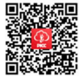
手机应用 人保寿险管家APP