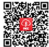
手机应用 人保寿险管家APP