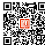
微信公众号 人保寿险E服务

我公司将秉承“ 人民保险 服务人民 ”的服务理念，为您提供专业、高效、温暖的服务，再次感谢您的信任和支持！