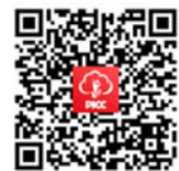
手机应用 人保寿险管家APP